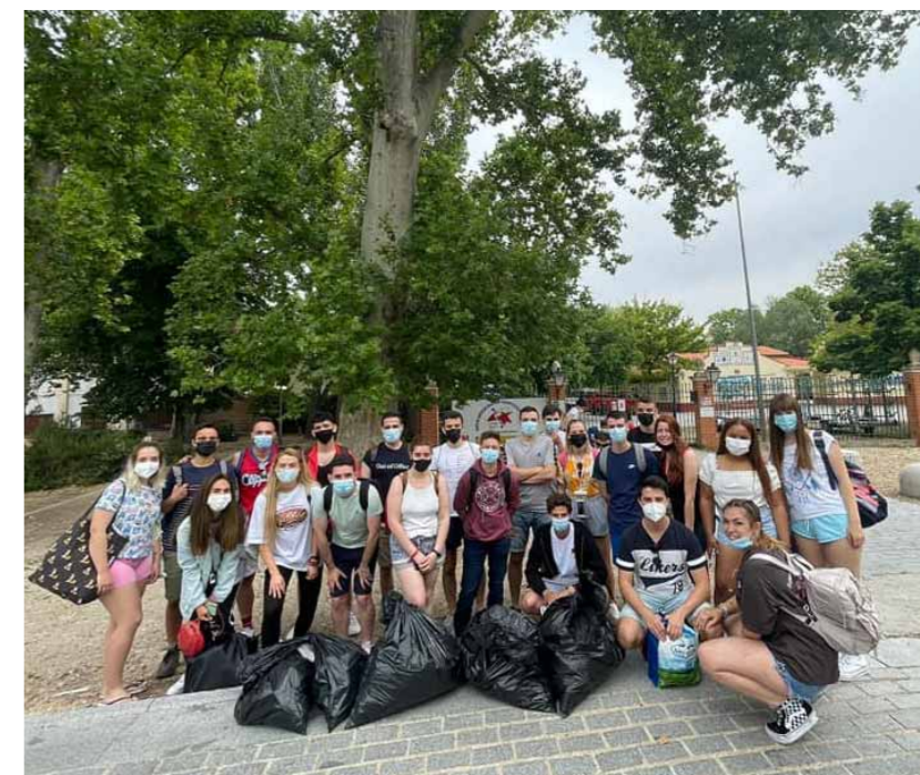
Por un Tajo Vivo. Las Juventudes Socialistas de Aranjuez volvieron a salir a recoger basura de las orillas del río. “Debemos cuidar nuestro medio ambiente, es espectacular la barbaridad de cosas que tiramos al suelo. Un año más y siempre reivindicando un caudal ecológico para el río Tajo”.